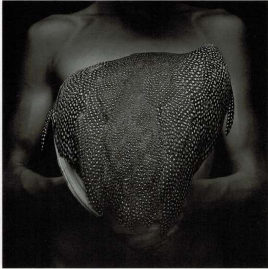
Mario Cravo Neto Criança Voodoo I. 1989