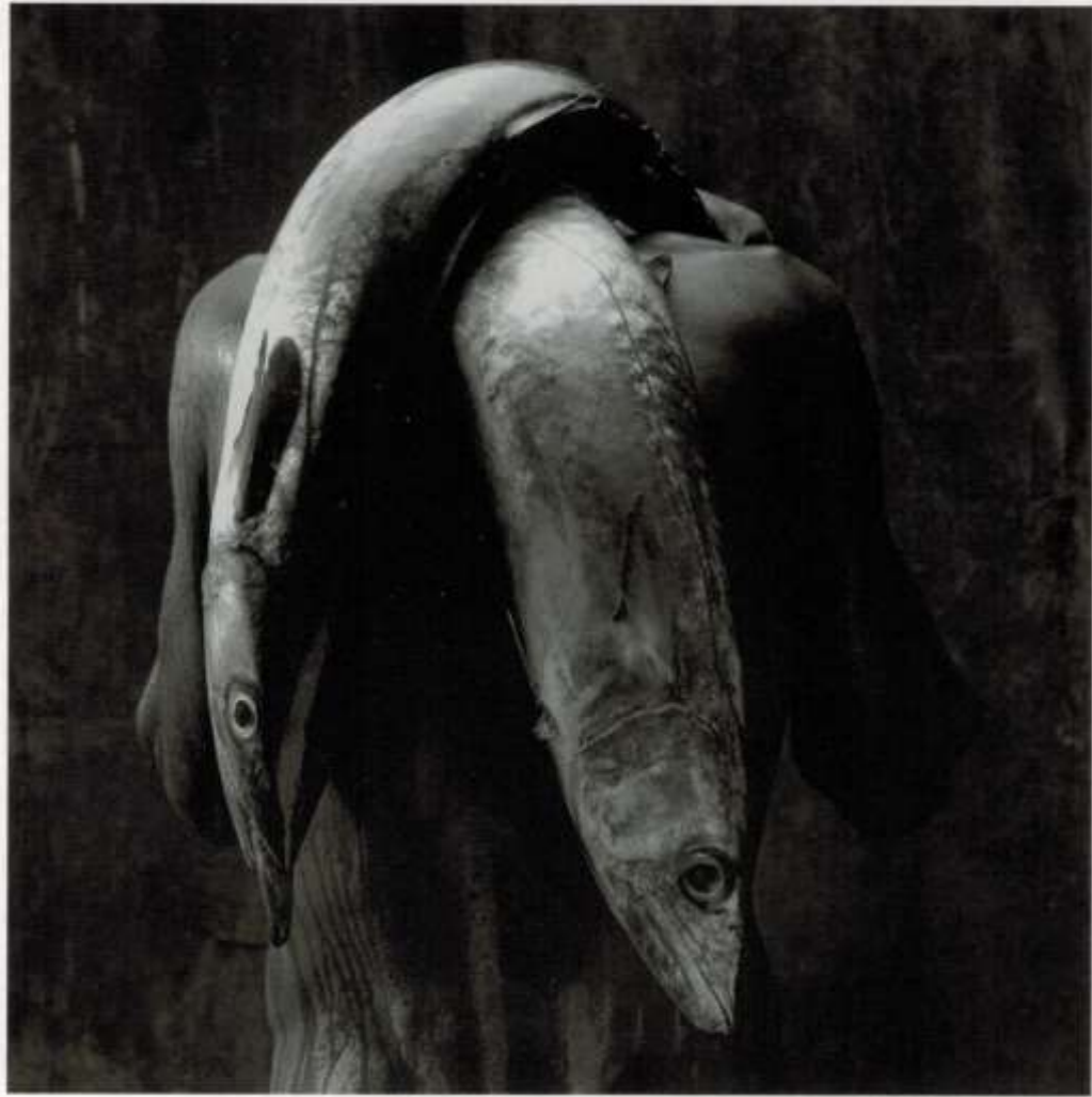
Mario Cravo Neto Homem com dois peixes, 1992